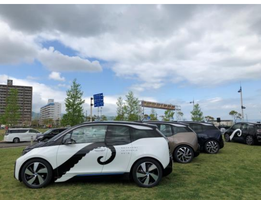
BMW i3は、会期中展示される他、オフィシャル・カーとして街を走行

「瀬戸内国際芸術祭2019」が、4月26日開幕しました。サンポート高松の大型テント広場にて行われた開会式では、讃岐獅子舞保存会によるオープニングアクトの後、実行委員長の浜田恵造・香川県知事が開会を宣言、いよいよ始まりました。国内外から多くのゲストを迎えるこの機会、私たちも瀬戸内人の一人として盛り上げていきたいと思えます！