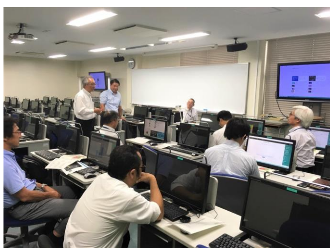
講義を熱心に聴く先生たち

「香川高等専門学校のソリューション」と「金融経済」の異なる視点が、クロスオーバーすることで新しい発想が生まれ、地域を盛り上げる原動力となっていきます。